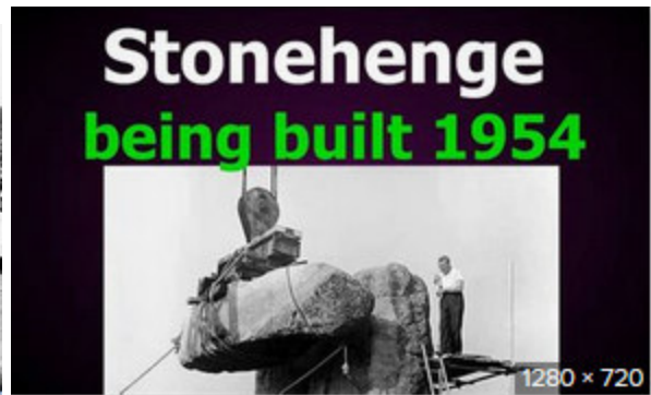
Do 105 Photos Show Ston... exposingtruth.com