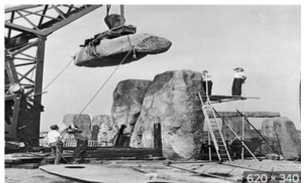
Shock: 1954 Photos Show...