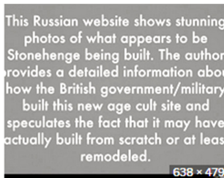
When & How Was Stonehenge Built? Th... historyextra.com