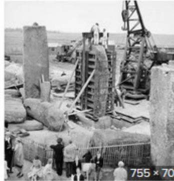
Do 105 Photos Show Stonehenge Beln... exposingtruth.com